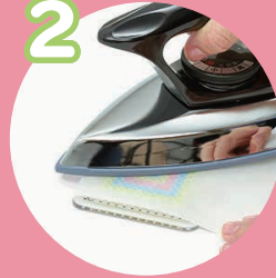
アイロンをかけて