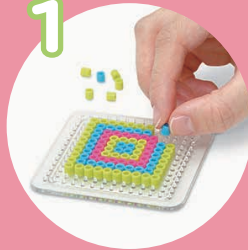
ビーズをならべて